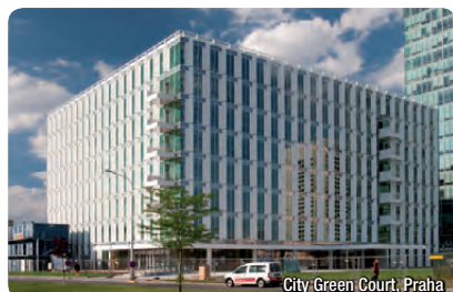
Skladba ALPOLIC®/fr SCM