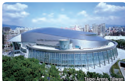
Skladba ALPOLIC®/fm TCM