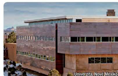
Skladba ALPOLIC® A2